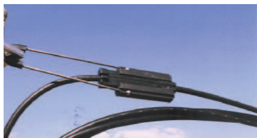
PA1500 / PA2000