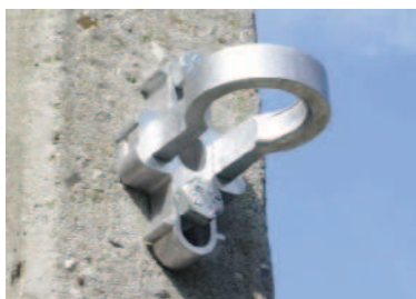
CA1500 / CA2000

MATERIALE PER RETI TESE SU PALI O FACCIATE